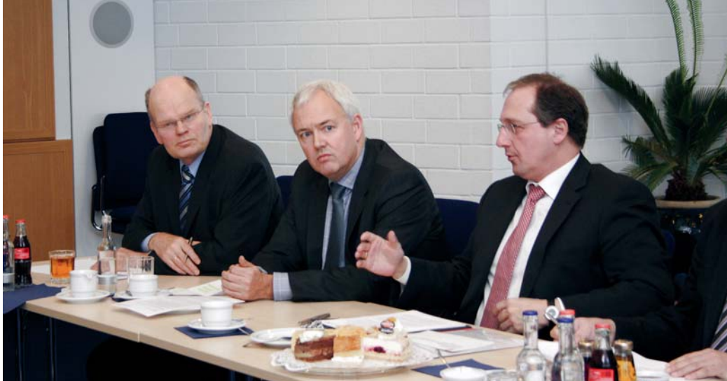
Bis 2011 soll alles fertig sein. Die dänische Vega Salmon A/S siedelt sich mit einer neuen Fabrik in Handewitt an und schafft rund 120 Arbeitsplätze.