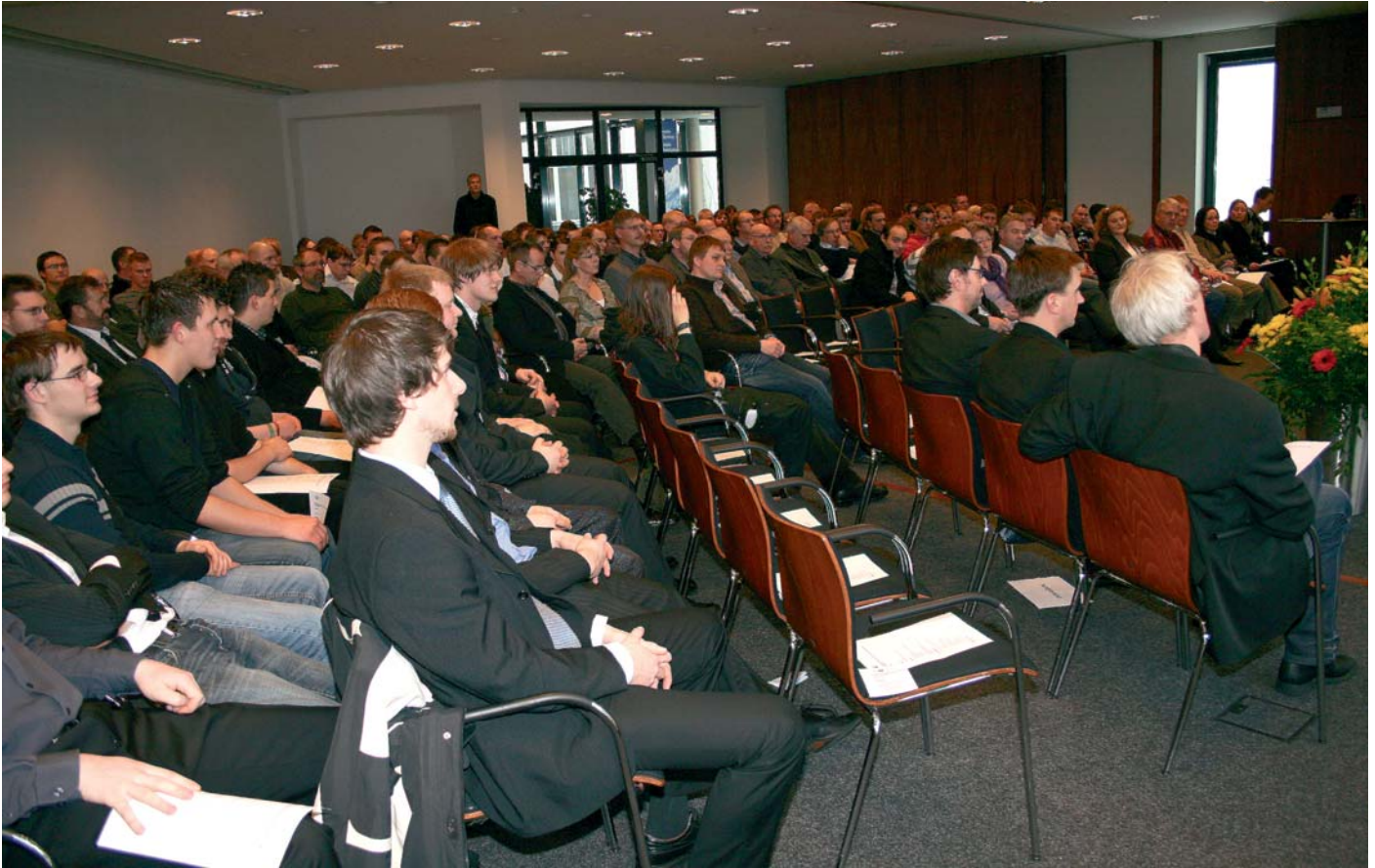
Knapp 150 Absolventen aus neun Berufsgruppen haben an den Winterprüfungen der IHK Flensburg teilgenommen.