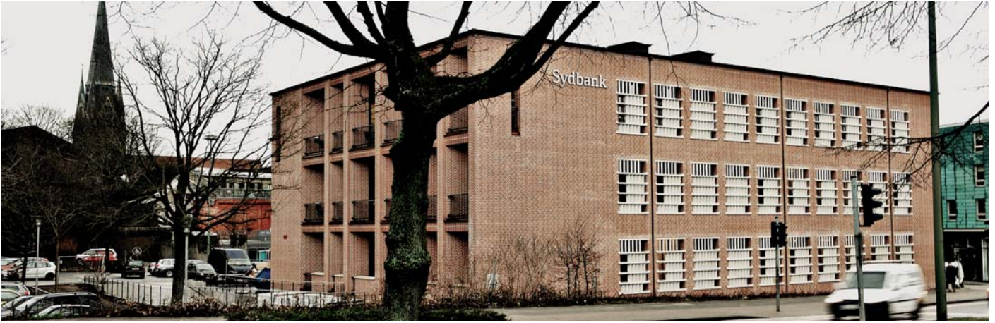
Das Hauptgebäude der Sydbank A/S in Flensburg.