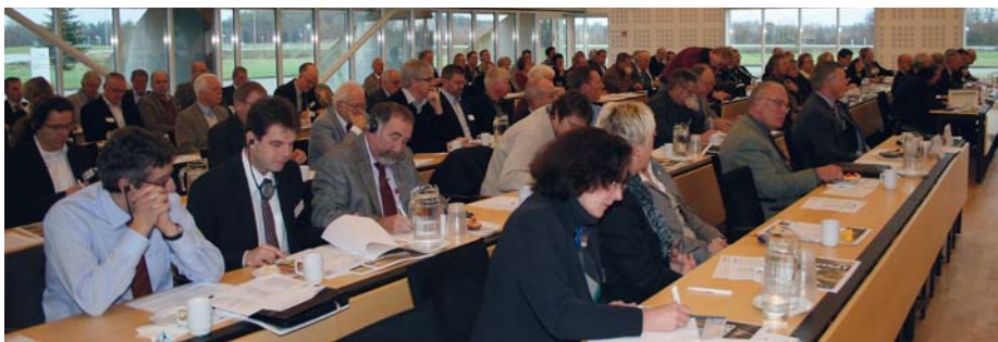
Die dritte deutsch-dänische Wirtschaftskonferenz am 30. November 2009 im Transportzentrum in Padborg brachte den Durchbruch. Nun ist ein Verkehrsabkommen in greifbare Nähe gerückt.