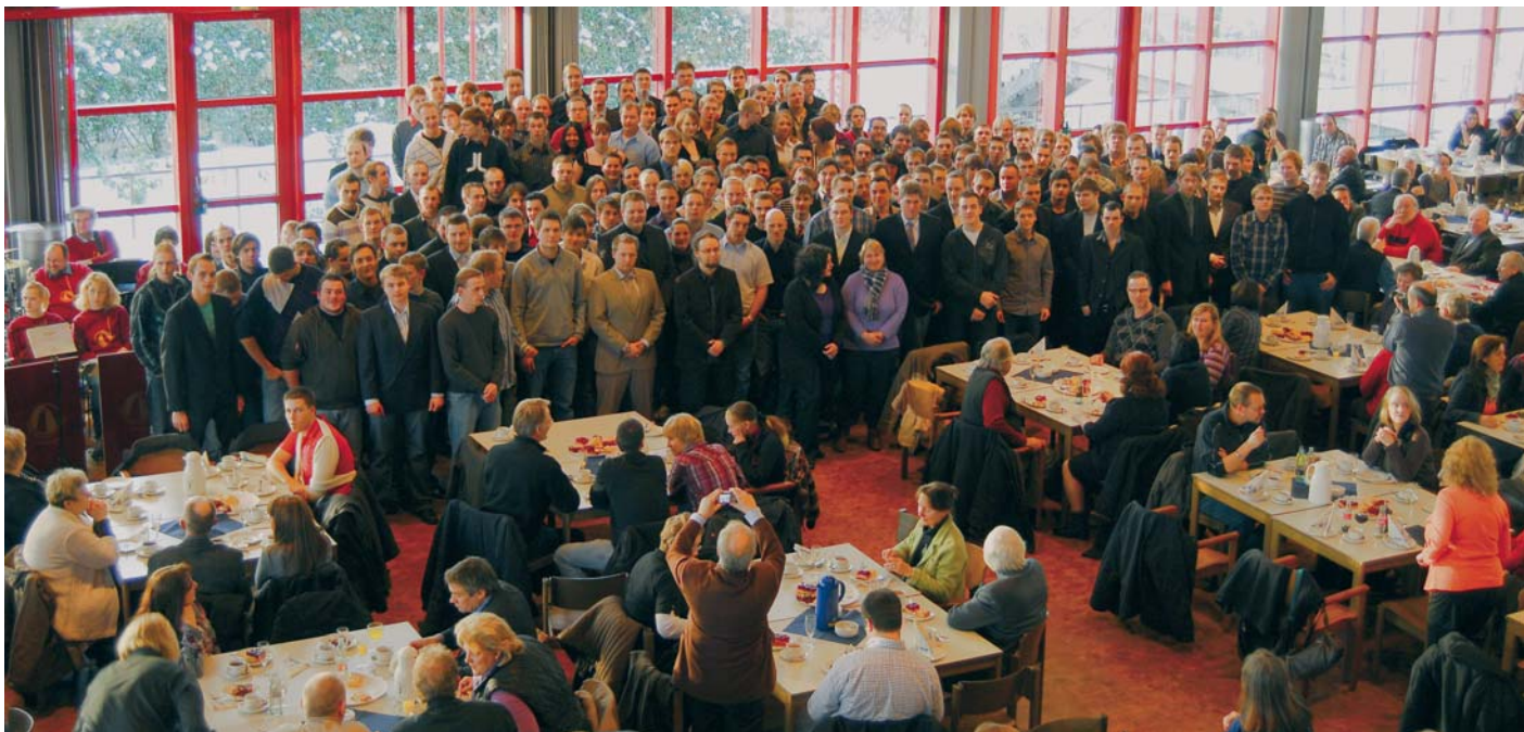
Mehr als 200 Facharbeiterzeugnisse wurden in der Kantine der Kieler Stadtwerke an die ehemaligen Auszubildenden überreicht.

In Kiel erhielten 224 ehemalige Auszubildende aus insgesamt 17 Berufen nach bestandener Abschlussprüfung ihre Facharbeiterbriefe. 138 Prüferinnen und Prüfer aus 41 Prüfungsausschüssen waren ehrenamtlich im Einsatz, um die Absolventen in den IT-, Metall- und Elektroberufen, als Technische Zeichner und Chemielaboranten praxisnah zu prüfen.