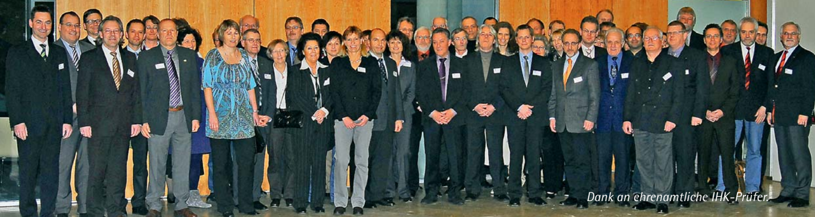
Dank an ehrenamtliche IHK-Prüfer.