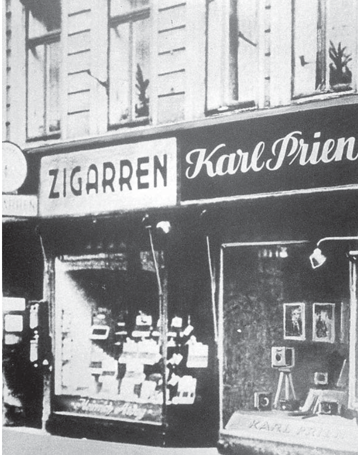
Das Geschäft in der Holstenstraße 73, 1910.