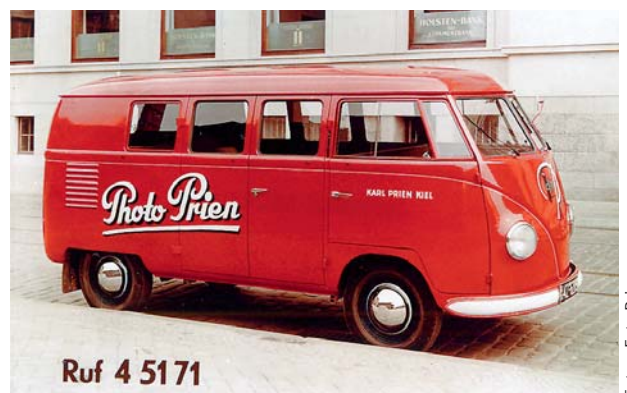
Lieferwagen aus den 1950er-Jahren.

„Auch an uns geht die Krise nicht vorbei, doch wir lassen uns nicht einschüchtern und