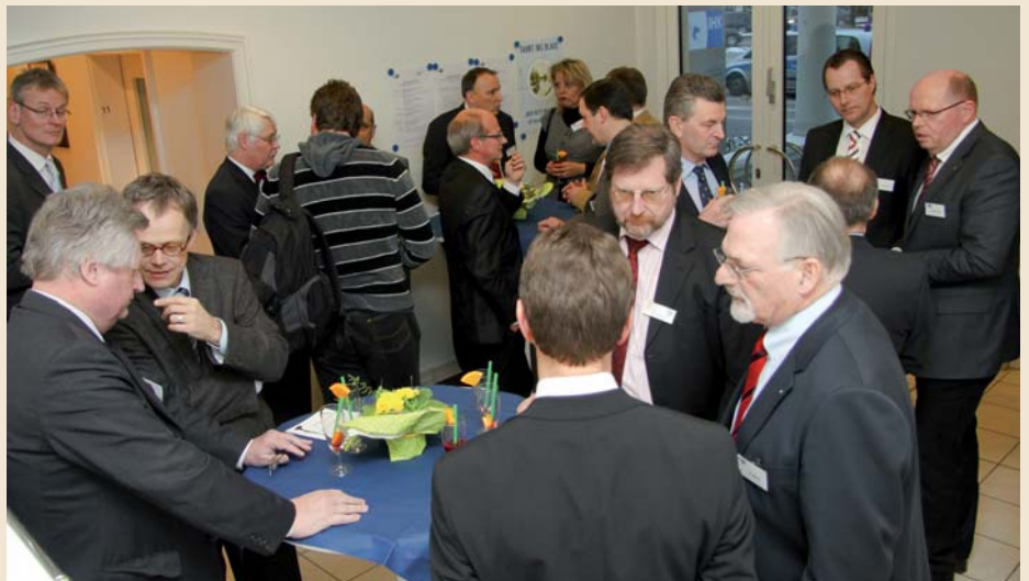
Der 14. Merkur-Treff bot Journalisten und Wirtschaftsrepräsentanten vielfältige Möglichkeiten zum Austausch.