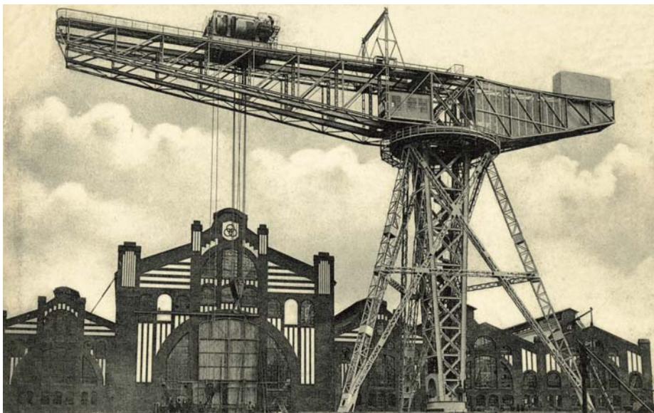
Der Ausrüstungskran der Germania-Werft, 1910.