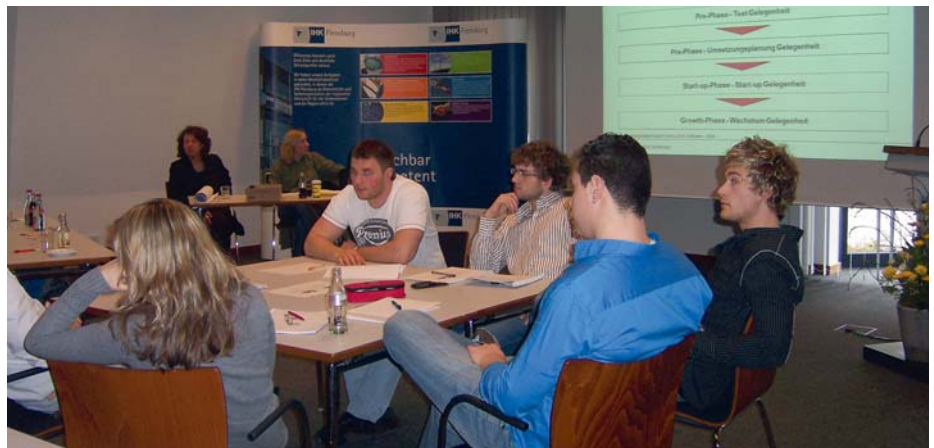
Interessierte Studenten informieren sich über Aktivitäten der IHK Flensburg.

Außerdem kommen die Studierenden mit regionalen und landesweiten Gründungsunterstützern in Kontakt. Die Fachhochschule Flensburg präsentiert ihr Unterstützungsprogramm, wie auch das Idea-House der Süddänischen Universität. Die Wirtschaftsförderungs- und Regionalentwicklungsgesellschaft Flensburg/Schleswig mbH (WiREG) und die IHK Flensburg stellen sich als regionale Unterstützer und als Repräsentanten des Gründungsnetzwerkes IxNxI in der Region Schleswig-Flensburg vor. Die Wirtschaftsförderung und Technologietransfer