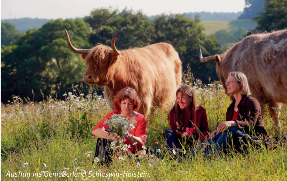
Ausflug ins „Genießerland Schleswig-Holstein.“