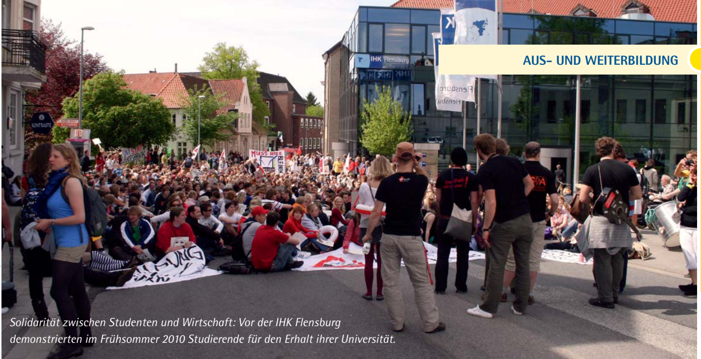
Solidarität zwischen Studenten und Wirtschaft: Vor der IHK Flensburg demonstrierten im Frühsommer 2010 Studierende für den Erhalt ihrer Universität.