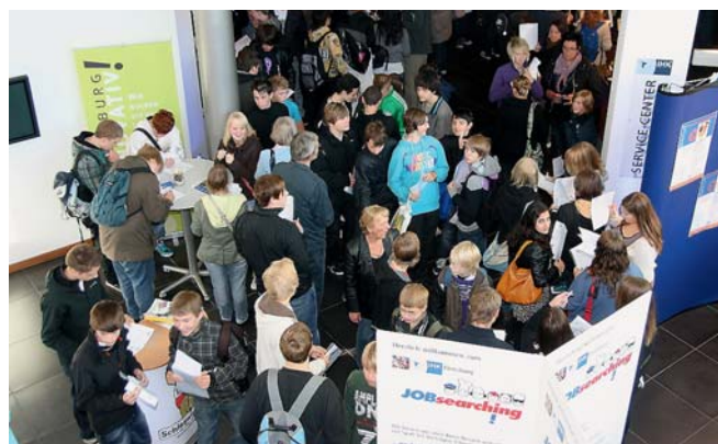
Informationsveranstaltung mit Rekordbeteiligung: IHK-JOBsearching Ende September 2010 in der IHK Flensburg.

2010 hat die IHK Flensburg im Geschäftsbereich Aus- und Weiterbildung 6.265 Berufsausbildungsverhältnisse betreut, davon 4.766 im kaufmännischen und 1.499 im gewerblichen Bereich. Bei 2.103 Kandidaten wurde eine Zwischen- und bei 2.560 Kandidaten eine Abschlussprüfung abgenommen, 538 Ausbildungsbetriebe wurden vor Ort beraten und 264 Prüfungsausschüsse mit 1.446 ehrenamtlichen Prüfern bestellt. Im Weiterbildungsbereich absolvierten 252 Kandidaten erfolgreich eine IHK-Aufstiegsfortbildungsprüfung und 346 eine Ausbildereignungsprüfung.