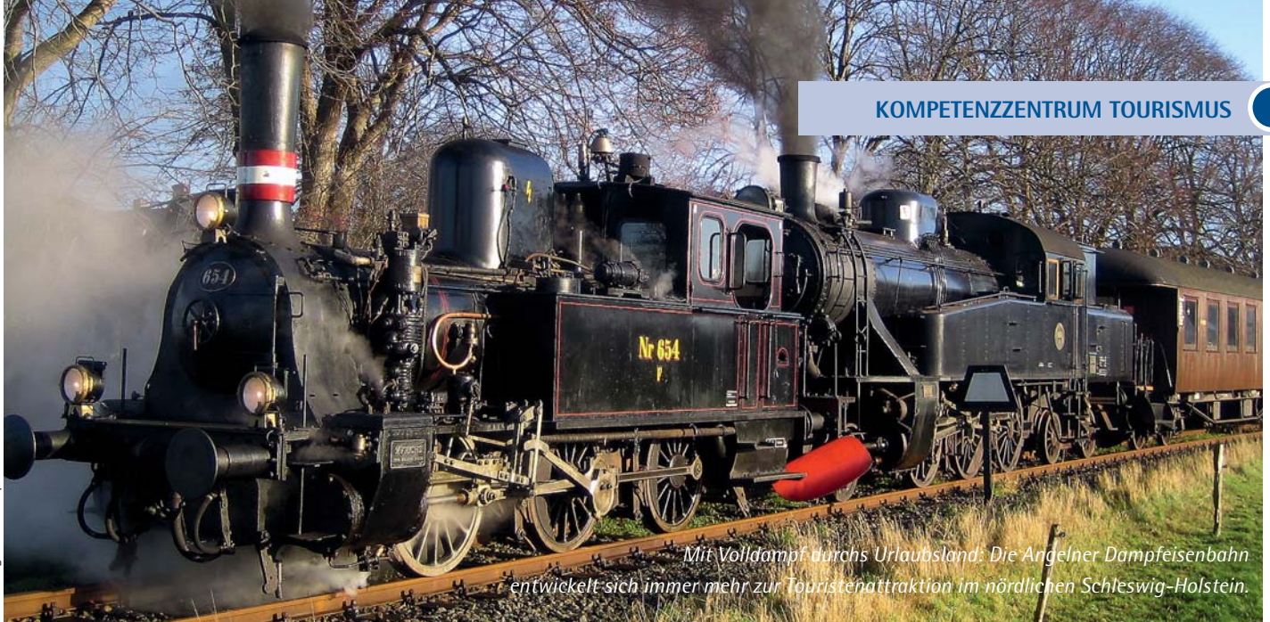
Mit Volldampf durchs Urlaubsland: Die Angelner Dampfeisenbahn entwickelt sich immer mehr zur Touristenattraktion im nördlichen Schleswig-Holstein.